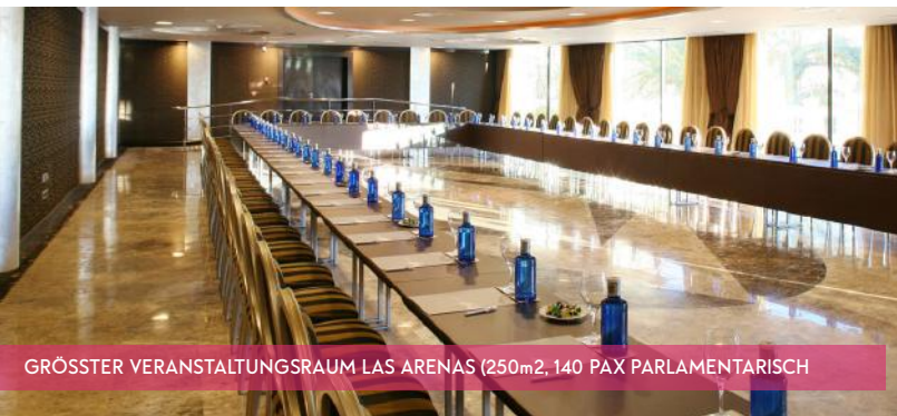
GRÖSSTER VERANSTALTUNGSRAUM LAS ARENAS (250m 2 , 140 PAX PARLAMENTARISCH)