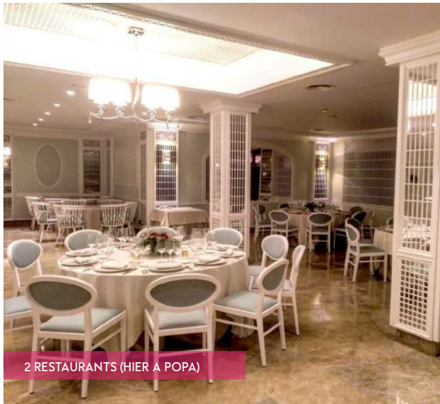
2 RESTAURANTS (HIER A POPA)