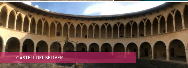
CASTELL DEL BELLVER