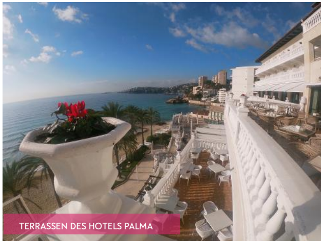
TERRASSEN DES HOTELS PALMA