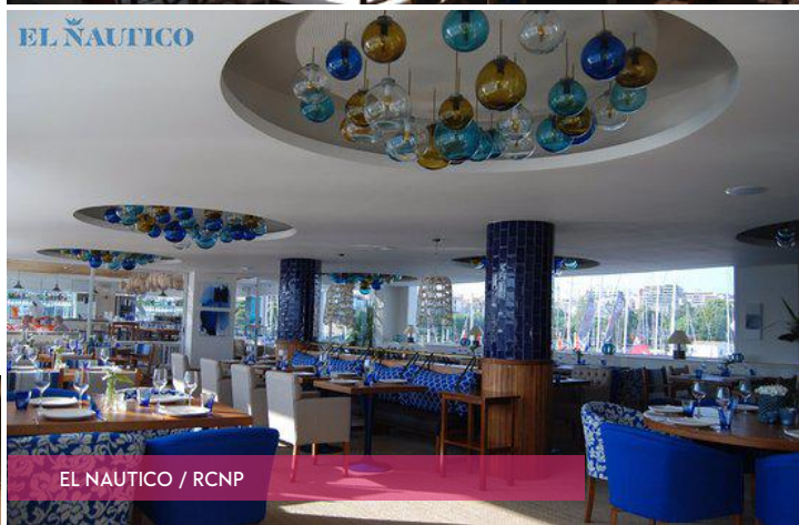
EL NAUTICO / RCNP