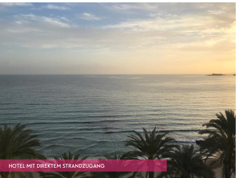
HOTEL MIT DIREKTEM STRANDZUGANG