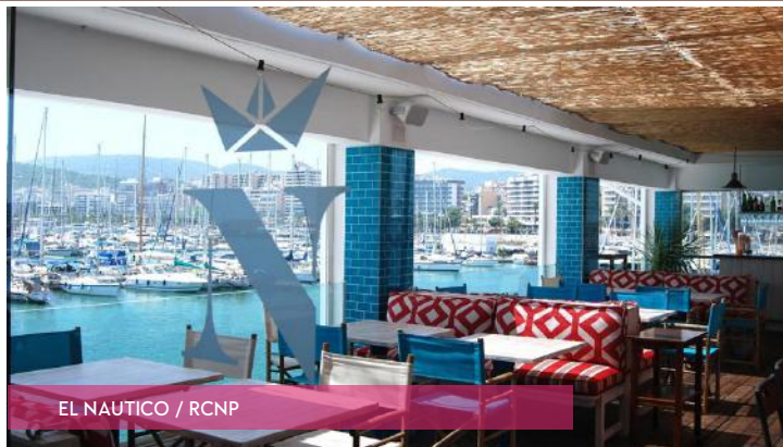
EL NAUTICO / RCNP