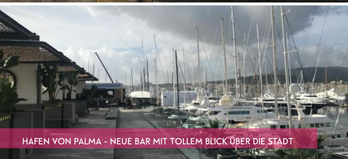
HAFEN VON PALMA - NEUE BAR MIT TOLLEM BLICK ÜBER DIE STADT