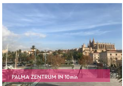
PALMA ZENTRUM IN 10min