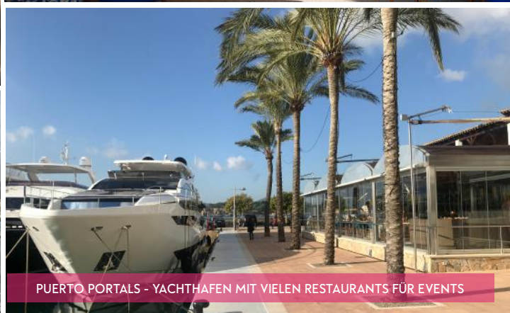
PUERTO PORTALS - YACHTHAFEN MIT VIELEN RESTAURANTS FÜR EVENTS